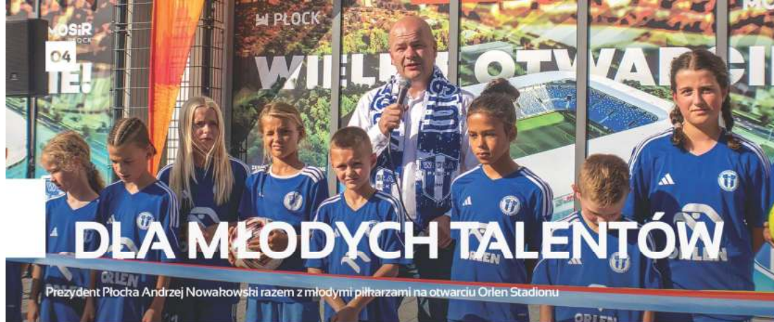
Prezydent Płocka Andrzej Nowakowski razem z młodymi piłkarzami na otwarciu Orlen Stadionu

Nowe boiska treningowe Wisły Płock nabierają kształtu. Prace przy ich budowie wkręczyły w kolejny etap.