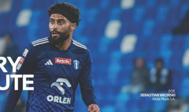
FOT. SEBASTIAN WICINIŃSKI Wisła Płock S.A.

24 lutego 2025 roku zamknięte zostało zimowe okno transferowe w Betclit I Lidze. Rzutem na taśmę Nafciarze przeprowadzili kilkanaście transferów, mających na celu zwiększenie rywalizacji w I drużynie oraz z myślą o przyszłości. Niektóre z nich dotyczyły również naszego drugiego zespołu, gdzie pojawiło się kilka nowych twarzy.