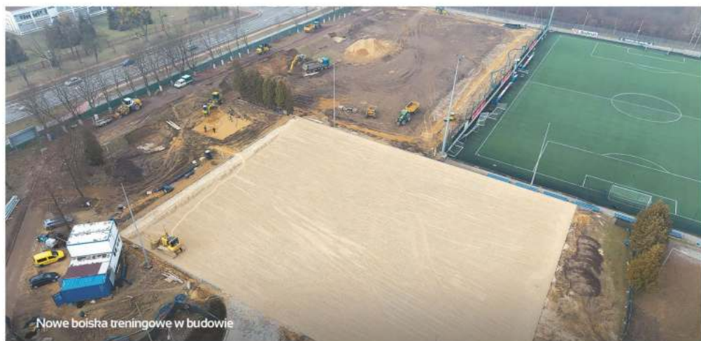
Nowe boiska treningowe w budowie